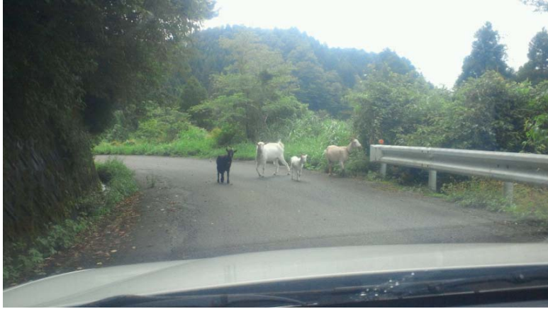
行きがけのラリーにて